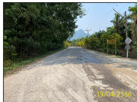
ถนนทางเข้าโครงการ รูปที่ 1-1 ตำแหน่งที่ตั้งโครงการ